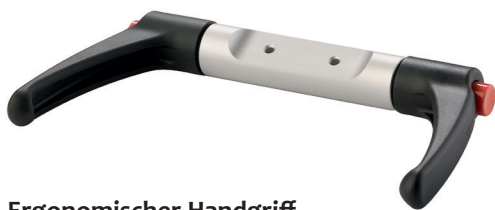
Ergonomischer Handgriff 360° verstellbar mit Ausrastknopf