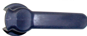
Sterile Abdeckung für ergonomischen Handgriff