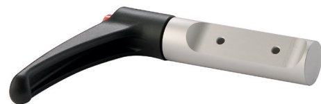
Ergonomischer Handgriff 360° verstellbar mit Ausrastknopf